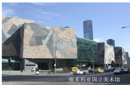
维多利亚国立美术馆