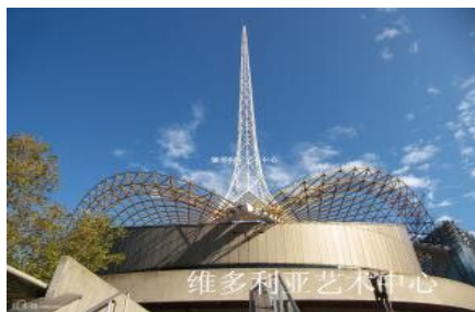
维多利亚艺术中心